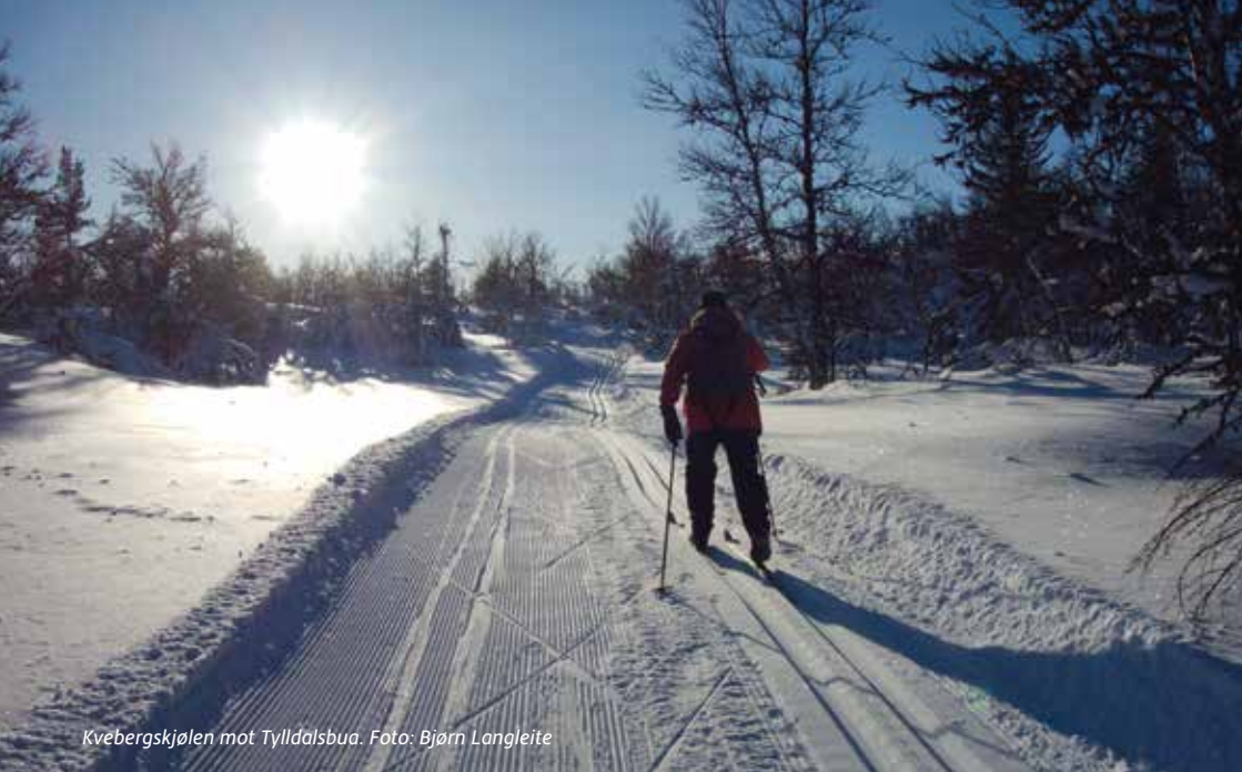
Kvebergskjølen mot Tylldalsbua.