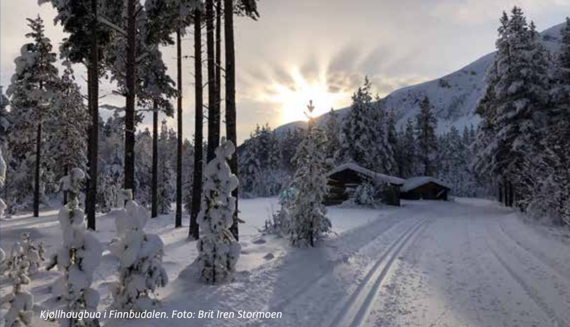
Kjøllhaugbua i Finnbudalen.