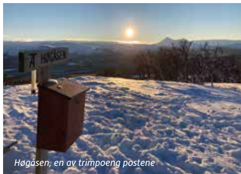
Høgåsen, en av trimpoeng postene

Samarbeidsprosjekt med Alvdal LHL, Alvdal Pensjonistforening, Alvdal Revmatikerforening, Alvdal Helselag og Alvdal Turforening. Tiltaket er en flott sosial arena der foruten trimmen, samt en lang god kaffesamtale som er minst like viktig. Det settes stadige rekorder