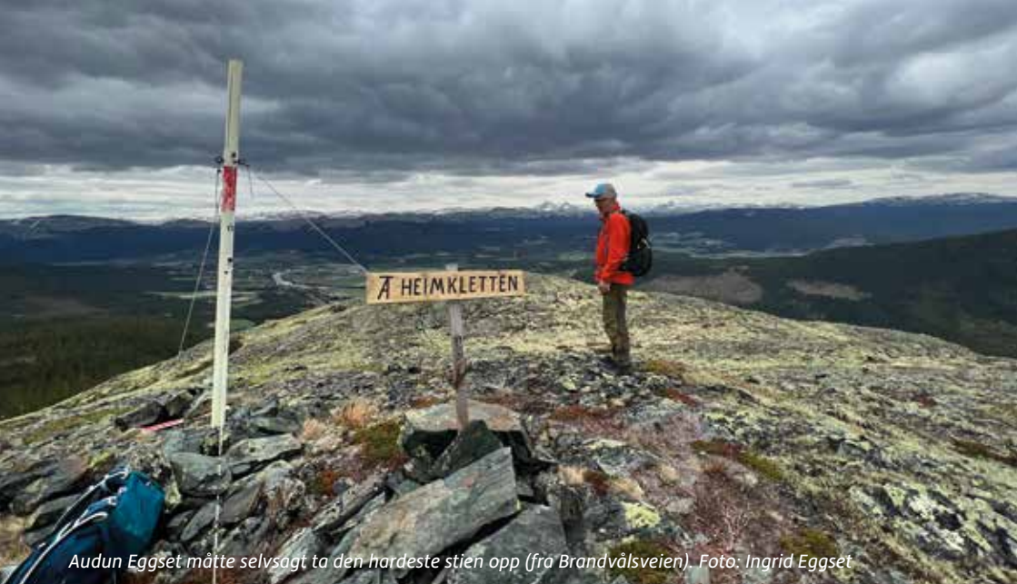
Audun Eggset måtte selvsagt ta den hardeste stien opp (fra Brandvålsveien).