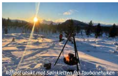
Råflott utsikt mot Sølnekletten fra Taubanehuken

Høgåsen 991 moh, Kvitvola 1248 moh og Bjønnåsen 922 moh. Tre på topp - vinter går fra 1. januar til 31. mars. Fin trening til sommerens Ti på topp. Registrere deg via TRIM POENG appen - Søk «Vinterturer Alvdal 24».