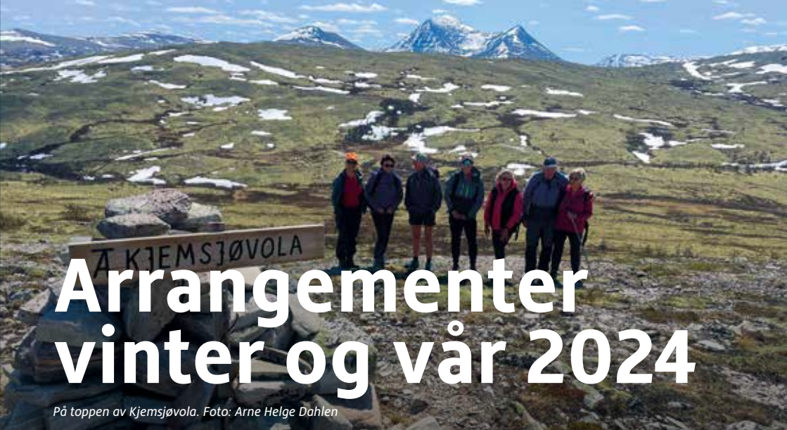
På toppen av Kjemsjøvola.