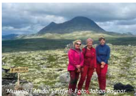
Musvola i Alvdal Vestfjell: Foto: Johan Ragnar