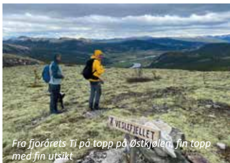
Fra fjorårets Ti på topp på Østkjølen, fin topp med fin utsikt

Flott topp på Østkjølen. Vi kjører til Innerenglia, og går på bilveien opp til toppen. God utsikt. Ca. en times gange hver vei.